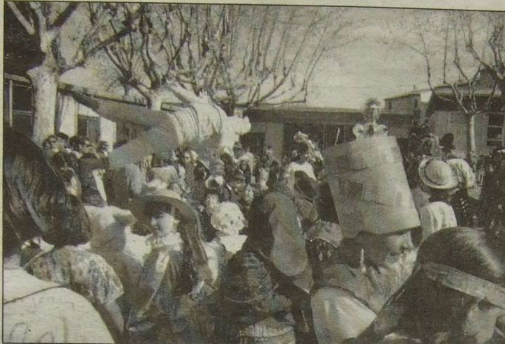
Carnaval débarque dans nos villes et villages, ; l'occasion de mettre le monde cul par dessus tête!

Samedi 26 février : 11h, 17h, 22h : Las Cudenos.